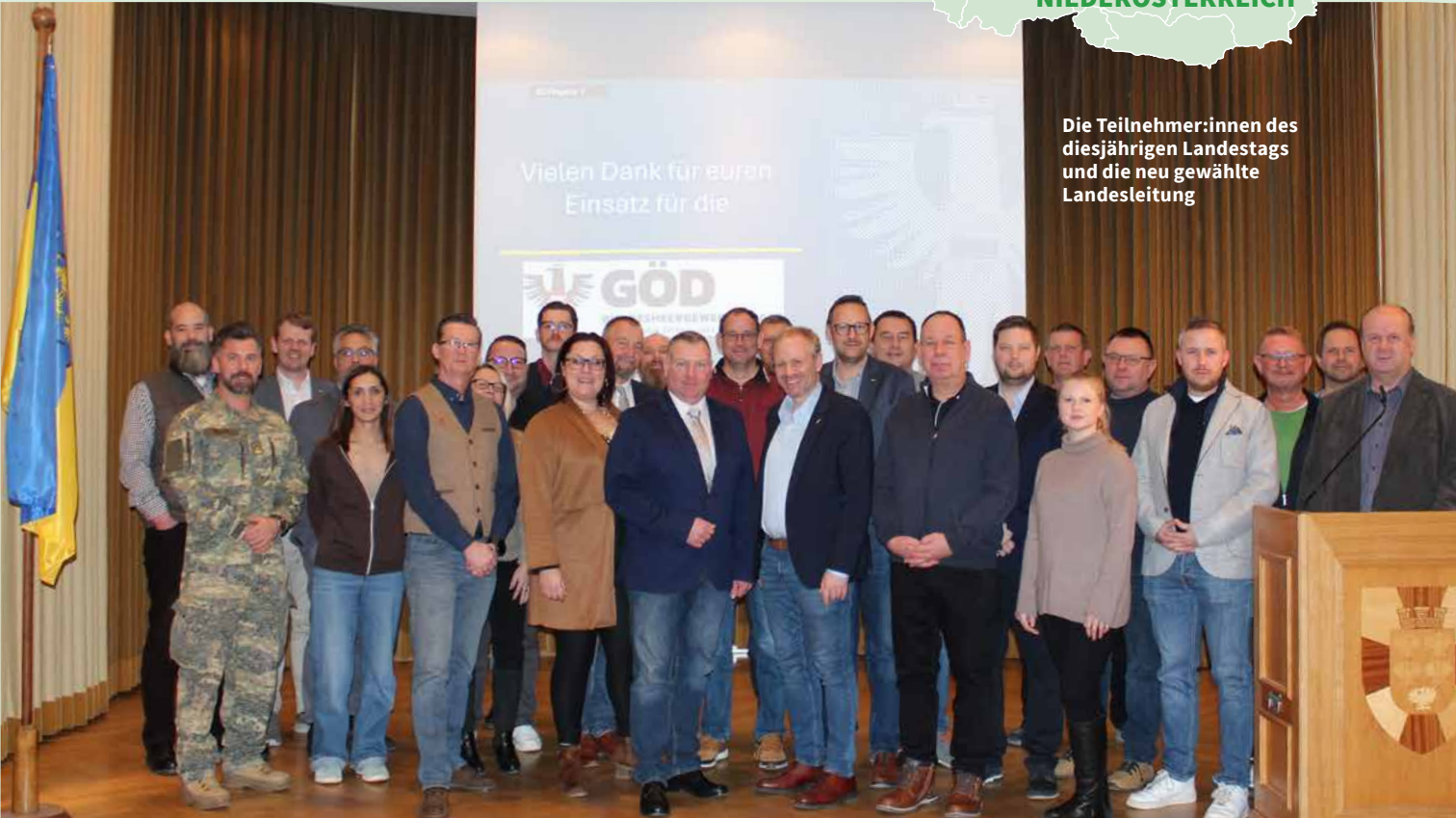
Die Teilnehmer:innen des diesjährigen Landestags und die neu gewählte Landesleitung