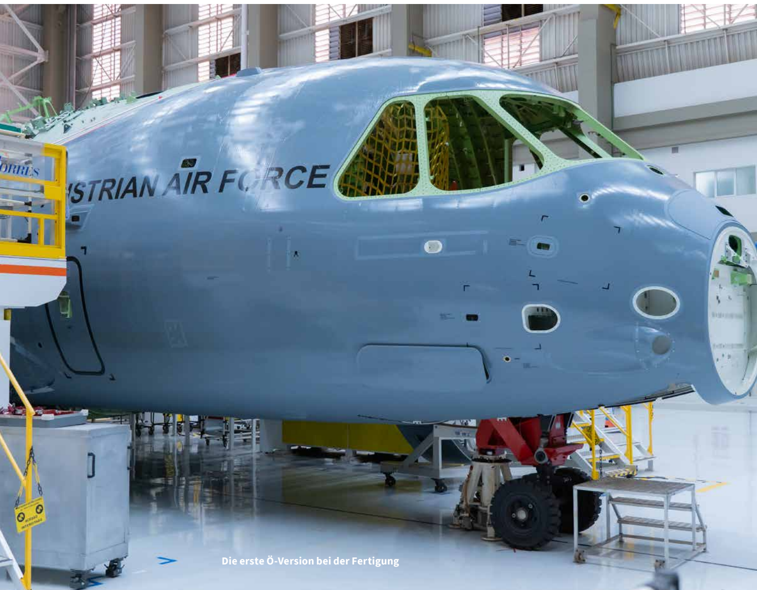
Die erste Ö-Version bei der Fertigung

Das Luftfahrzeug kann durch seine Bauweise rasch für die unterschiedlichen Einsatzrollen konfiguriert werden. Dazu zählen Cargo- und Truppentransport, Luftlandeeinsätze, Absetzen von Lasten, medizinische Evakuierung (mittels MEDEVAC-Container), Feuerbekämpfung aus der Luft und auch Luft-Luftbetankung als Receiver.