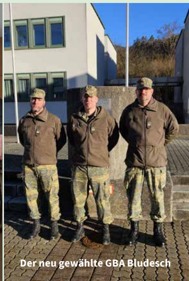
Der neu gewählte GBA Bludesch