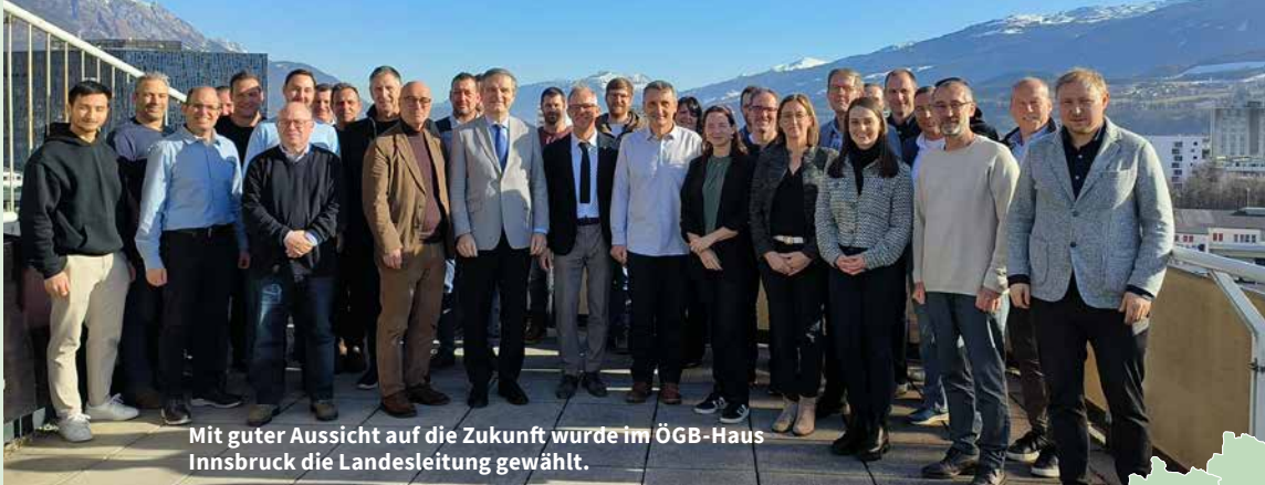
Mit guter Aussicht auf die Zukunft wurde im ÖGB-Haus Innsbruck die Landesleitung gewählt.