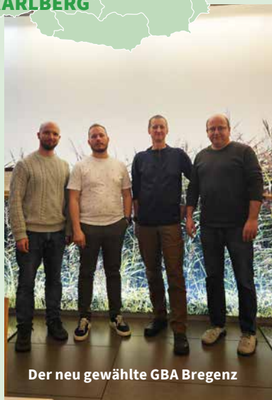
Der neu gewählte GBA Bregenz