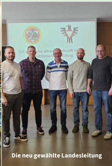
Die neu gewählte Landesleitung